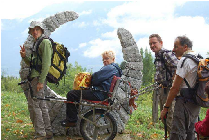
Une partie du groupe HCE38 devant la sculpture nommée "Levant dominant " (réalisée en 2010 par Gilbert FRIZON) à Vatilieu.