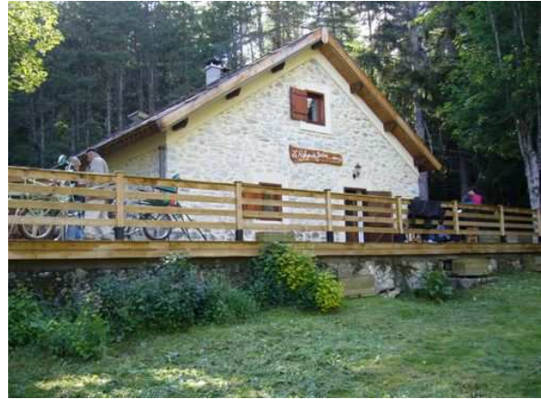
Le refuge Jérôme

Prix tout compris : 110 € (40€ d'arrhes à l'inscription, solde 15 jours avant le séjour)